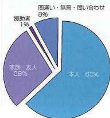
■相談者と対象者の続柄 (2008年 n=1187)