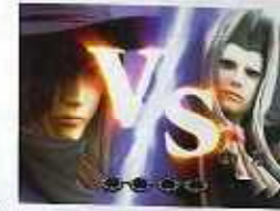
Van Helsing is a trademark and copyright of Universal Studios. Licensed by Universal Studios Licensing L.L.P. All Rights Reserved.