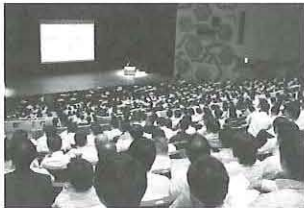
第2回講習会の会場の模様

平成29年6月14日(水)14時から、福岡市の福岡市民会館において、第2回「安心パチンコ・パチスロアドバイザー」講習会が開催された。