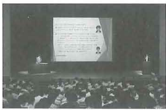
第3回講習会の会場の模様

平成29年6月28日(水)14時から、大阪市の大阪府立男女共同参画・青少年センター（ドーンセンター）において、第3回「安心パチンコ・パチスロアドバイザー講習会」が開催された。