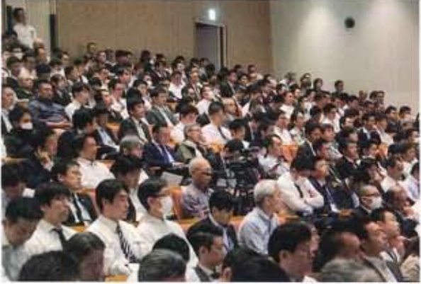
ほぼ満席となった会場