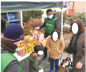
料品で地域の住民を出迎えた