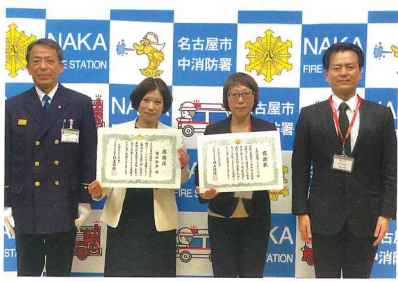
息の合ったチームワークで人命を救助した