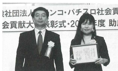
千葉県遊協が助成した「特定非営利活動法人千葉こども家庭支援センター」