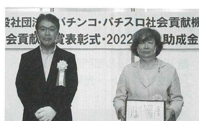
札幌方面遊協が助成した「公益社団法人心の里親会・奨学会」

当日は共同助成、一般助成、特別助成、特命助成の4つのジャンルの助成認定証贈呈式も行われ、24団体に計3580万円の助成を行った。このうち共同助成は、7つの組合から事業者に助成金が贈られた。 共同助成と特別助成、特命助成では、主に依存問題の予防解決に向けた取組みや研究を行っている事業者が対象になっているが、今年度の共同助成では、子どもの健全育成に向けた支援活動や災害復興支援を行っている事業者への助成も行われた。 札幌方面遊協が助成した「公益社団法人心の里親会・奨学会」は、児童養護施設で暮らしている子ども達の精神的支援をする目的で月1回程度の文通事業を行っているほか、就学する子どもにも入学時に必要な支援を行う入学祝寄贈事業を行っている。 また、福島県遊協では「一般社団法人ヴォイス・オブ・フクシマ」を助成した。同法人では、東日本大震災で大きな被害を受けた福島の人々の声から学ぶ震災の教訓「読むVoice of Fukushima」の制作事業をはじめ、映画上映会や被災者の交流会イベントも実施している。 千葉県遊協が助成した「特定非営利活動法人千葉こども家庭支援センター」では、刺激や人の気持ちに敏感な子ども達（HSC）の気質を理解し、サポー