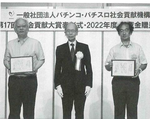
依存問題の予防と解決に取組む事業で助成を受けた「仙台夜まわりグループ」(左)と「ワンダーポート」(右)

当日は共同助成、一般助成、特別助成、特命助成の4つのジャンルの助成認定証贈呈式も行われ、24団体に計3580万円の助成を行った。このうち共同助成は、7つの組合から事業者に助成金が贈られた。 共同助成と特別助成、特命助成では、主に依存問題の予防解決に向けた取組みや研究を行っている事業者が対象になっているが、今年度の共同助成では、子どもの健全育成に向けた支援活動や災害復興支援を行っている事業者への助成も行われた。 札幌方面遊協が助成した「公益社団法人心の里親会・奨学会」は、児童養護施設で暮らしている子ども達の精神的支援をする目的で月1回程度の文通事業を行っているほか、就学する子どもにも入学時に必要な支援を行う入学祝寄贈事業を行っている。 また、福島県遊協では「一般社団法人ヴォイス・オブ・フクシマ」を助成した。同法人では、東日本大震災で大きな被害を受けた福島の人々の声から学ぶ震災の教訓「読むVoice of Fukushima」の制作事業をはじめ、映画上映会や被災者の交流会イベントも実施している。 千葉県遊協が助成した「特定非営利活動法人千葉こども家庭支援センター」では、刺激や人の気持ちに敏感な子ども達（HSC）の気質を理解し、サポー