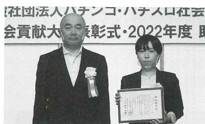
福島県遊協が助成した「一般社団法人ヴォイス・オブ・フクシマ」